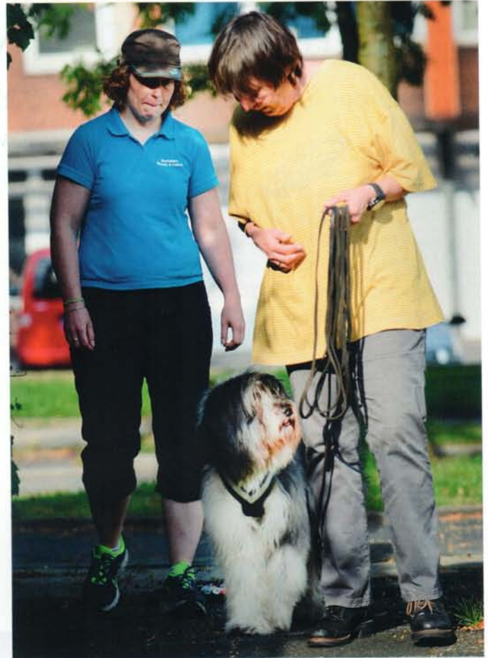
Paulchen zeigt sich etwas ratlos, so ganz scheint er die ihm gestellte Aufgabe nicht zu verstehen.

Auch Paulchen darf einmal sein Glück versuchen, über eine Entfernung von nur zehn Metern soll er einen Menschen finden. Die Witterung nimmt er auf, aber dann ist er verunsichert. ‚Was soll das?‘, scheint er sich zu fragen. „Einfach abwarten, Geduld haben, nicht auf